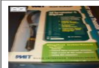
Cavi Mit Terminator 4... € 80,00